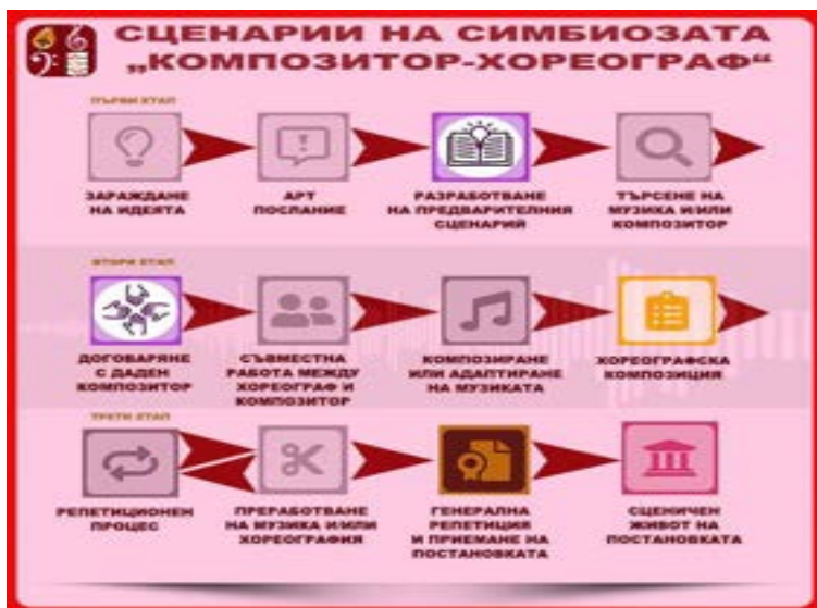
Фиг. 1. Етапи в творческия процес

Работен форум 2024 - минало, настояще и бъдеще на българския сценично обработен танц